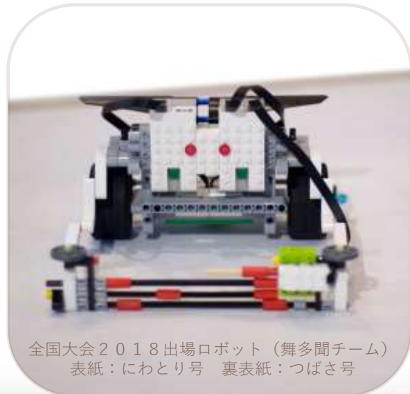
全国大会2018出場ロボット（舞多聞チーム） 表紙：にわとり号 裏表紙：つばさ号